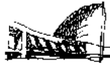
Tavola: 15 sostitutiva