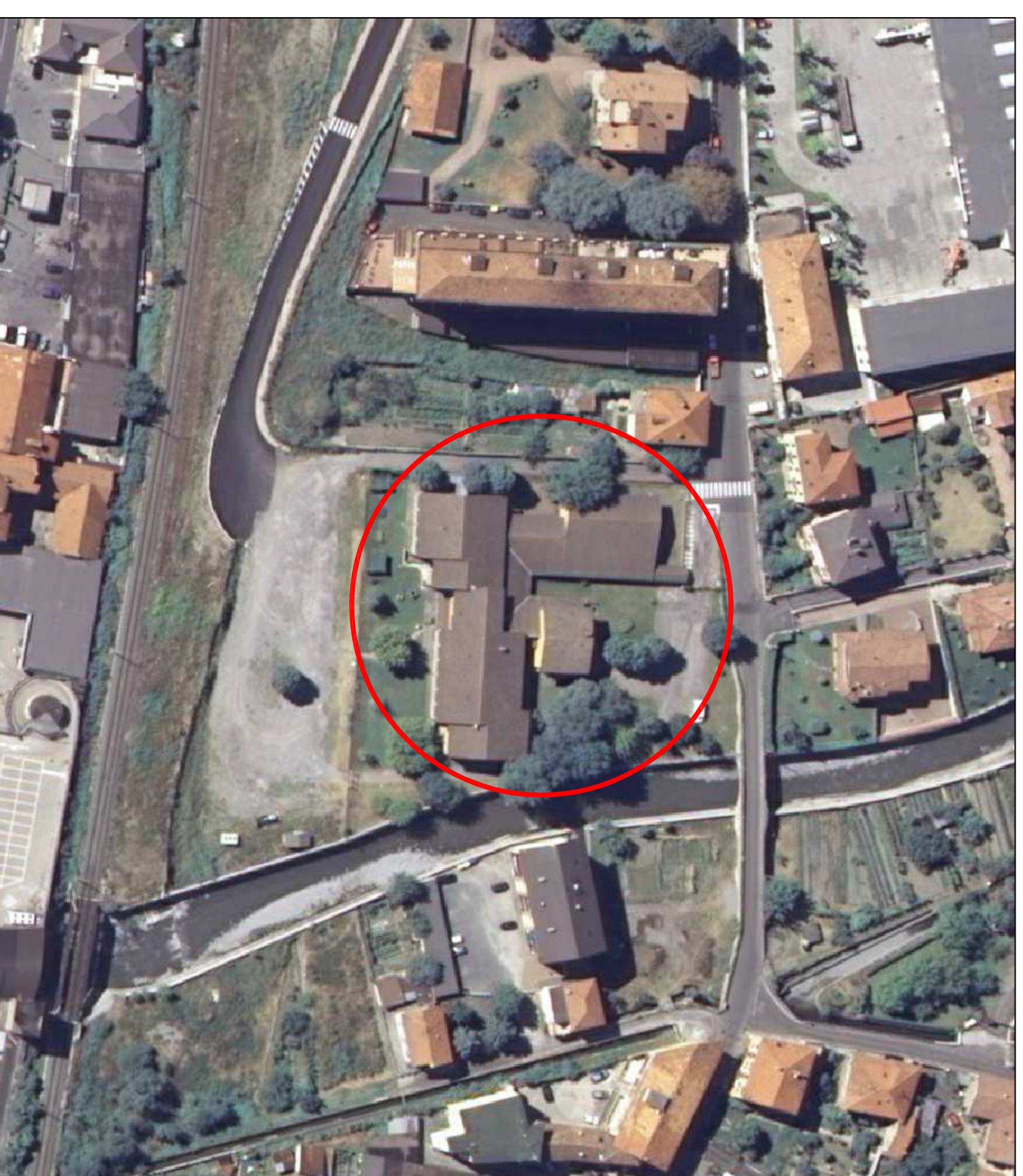
ESTRATTO FOTO AEREA SCALA /