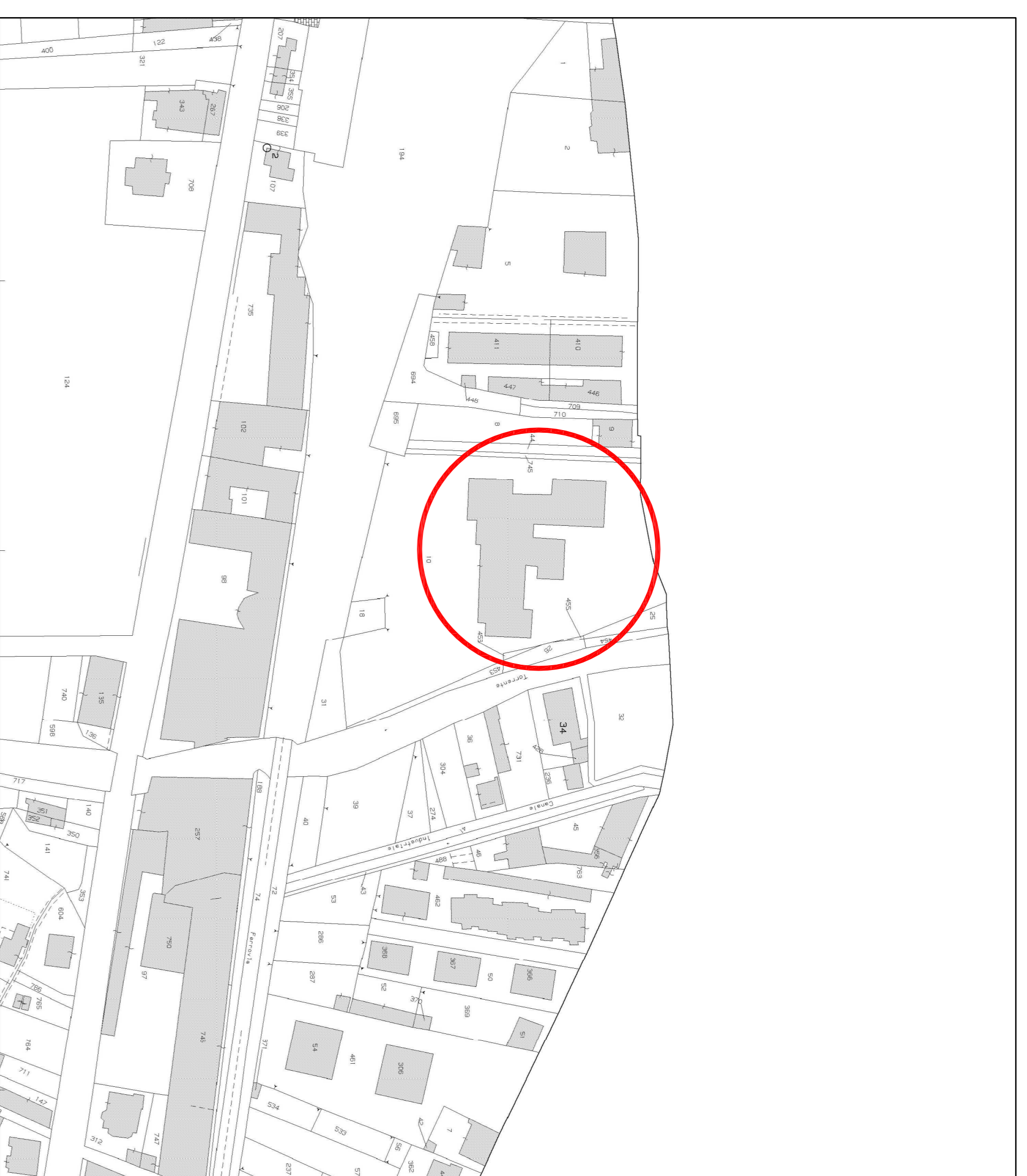
ESTRATTO DI MAPPA CATASTALE (foglio 10, particella 10) SCALA 1:1500

ARCHITETTO BRADARUNO LUCA C.F. BRD LCU 81M14 L0131V I.V.A. 03682700115 Codice Fiscale: 03682700115 - Susa (TO) E-mail: luca.brada@iberici.it Ordine degli Architetti della Provincia di Torino n. 7799