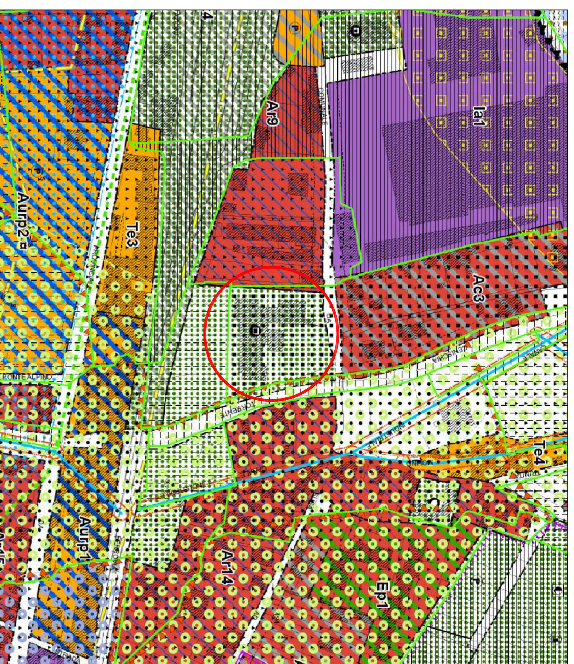
ESTRATTO DI P.R.G.C. VIGENTE (area per servizi pubblici - scuola esistente) SCALA 1:2000